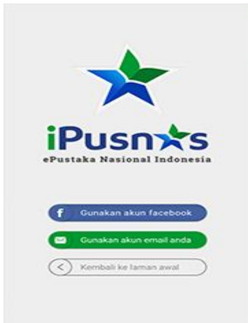
Gambar 1. Screen iPusnas