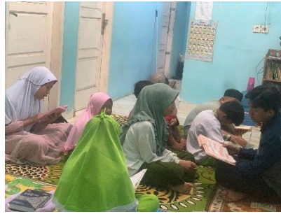
Gambar 2. Pelaksanaan Pendampingan Metode Talaqi

Selama proses pendampingan, terdapat beberapa kendala yang dihadapi. Pertama , beberapa peserta didik kesulitan fokus saat menyetorkan hafalan karena terganggu oleh teman sebayanya. Kedua , ada juga peserta didik yang belum siap menyetorkan hafalan karena belum mengulang materi sebelumnya. Selain itu, kurangnya motivasi menjadi tantangan tersendiri. Untuk mengatasi hal ini, guru pendamping secara konsisten memberikan semangat dan motivasi agar peserta didik lebih bersemangat dalam menghafal al-Qur'an.