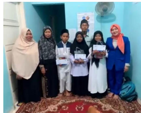
Gambar 4. Pelaksanaan Pemberian Hadiah

Untuk memotivasi peserta didik, kami menerapkan sistem penghargaan. Peserta didik yang berhasil mencapai target hafalan akan diberikan hadiah berupa al-Qur'an,