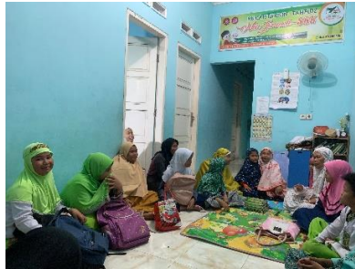
Gambar 1. Pemberian Motivasi

berkaitan dengan al-Qur'an dan tahfiz, dan juga memberikan motivasi tentang manfaat menghafal al-Qur'an, sehingga peserta didik yang akan menghafal al-Qur'an menjadi tertarik untuk menghafalnya dan juga menjadi semangat dalam menghafal. Sebagaimana dalam (Masni, 2017) motivasi adalah dorongan dasar yang menggerakkan seseorang untuk bertindak mencapai tujuan yang diinginkannya. Oleh karena itu, sebelum kegiatan dimulai pendamping memberikan motivasi yang dapat mendorong keinginan santri untuk menghafal al-Qur'an.