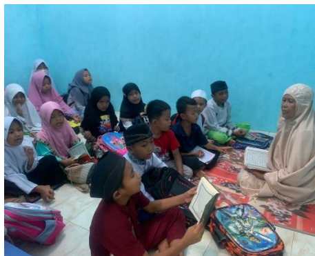
Gambar 3. Pelaksanaan Perlombaan Pendampingan Metode Talaqi

Sebagai upaya untuk memantapkan hafalan, setiap minggu diadakan sesi setoran hafalan. Dalam sesi ini, peserta didik secara bergantian membacakan hafalannya di hadapan guru pendamping. Guru akan memberikan evaluasi dan koreksi jika diperlukan. Setiap dua bulan sekali, diadakan lomba hafalan dengan berbagai macam bentuk, seperti menyambung ayat, menjelaskan kandungan surah, atau menyebutkan jumlah ayat dalam suatu surah. Kegiatan lomba ini bertujuan untuk meningkatkan semangat berkompetisi dan memotivasi peserta didik untuk terus belajar.