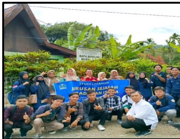
Gambar 1. Kegiatan Sosialisasi

Adapun gambar atau dokumentasi untuk memanfaatkan media mensosialisasikan tentang pentingnya menjaga dan melindungi cagar budaya dan untuk mengakses media Sosial SPI Sejarah Peradaban Islam IAIN Kerinci dengan link Instagram SPI IAIN Kerinci sebagai berikut: