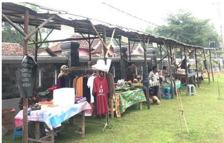
Gambar 3. Pasar Masyarakat Tradisional Sumber. Dokumentasi pribadi

Gambar di atas adalah proses pelatihan yang dilakukan oleh pustakawan, sehingga para pelajar dan bank sampah membantu mengajarkan cara pembuatan kursi daur ulang dari botol bekas dan produk tambal sulam yang dipasarkan melalui coop market sebagai bagian dari UKM masyarakat.