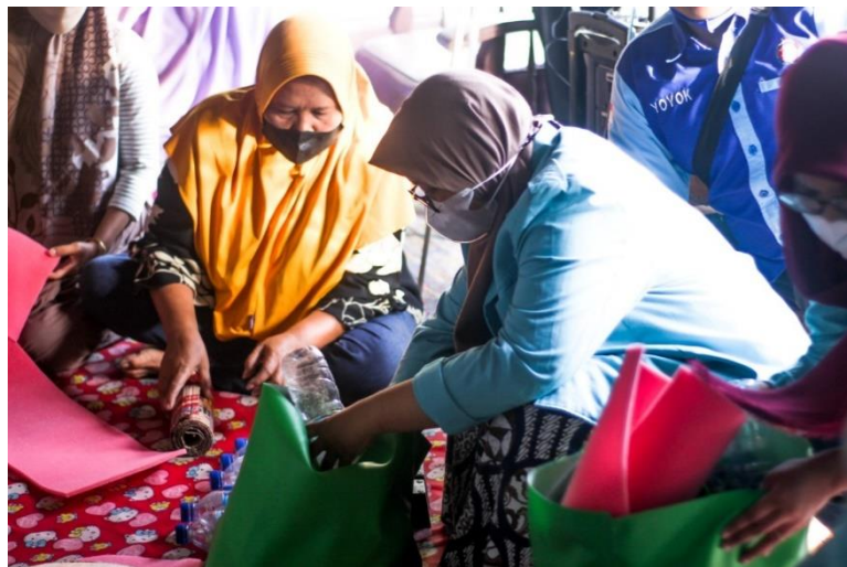
Gambar 2. Kolaborasi antara Pustakawan dan Masyarakat Sumber. Dokumentasi pribadi