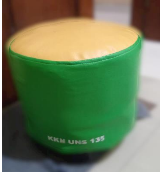
Gambar 4. Hasil dari Sampah Daur Ulang Sumber. Dokumentasi pribadi

Selain itu juga terdapat acara mingguan Pasar Minggu yang menjual produk-produk UKM masyarakat seperti barang daur ulang seperti kursi, tas dan makanan. Produk yang dijual kebanyakan adalah hasil dari daur ulang sampah dan hasil kerajinan yang dibuat oleh masyarakat sekitar.